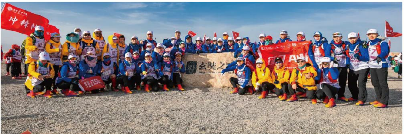
工商大道戈壁征赛